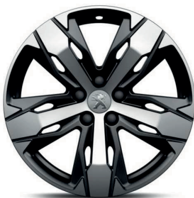
LOS ANGELES 18" Allure Pack /GT