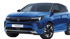
AZUL VERTIGO /