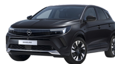
NEGRO PERLA /