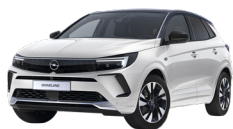
BLANCO BANQUISE /