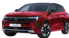
ROJO BRIGHT /